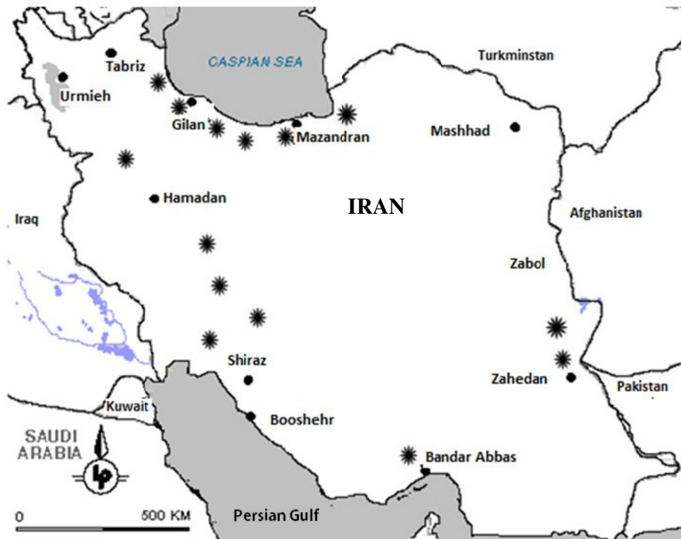
شکل ۳- نقشه پراکنش انارهای خودرو در ایران (اقتباس از Mirjalili & Poorazizi 2013b).