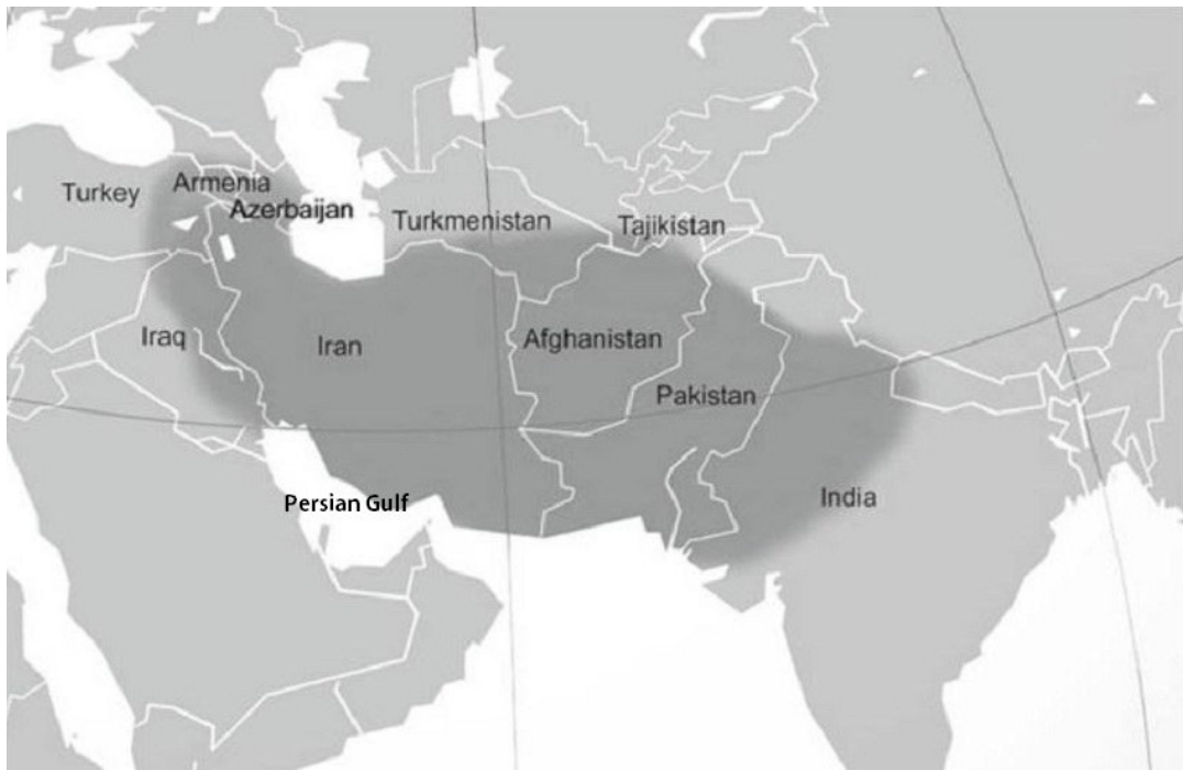
شکل ۲- نقشه پراکنش انارهای خودرو نشان دهنده خاستگاه و مرکز پیدایش آن (اقتباس از Morton 1987). Fig. 2. Dispersion map of wild pomegranates showing origin of pomegranate (From Morton 1987).

Melgarejo & Martínez 1992, Mirjalili & Poorazizi ) (2013b, c).