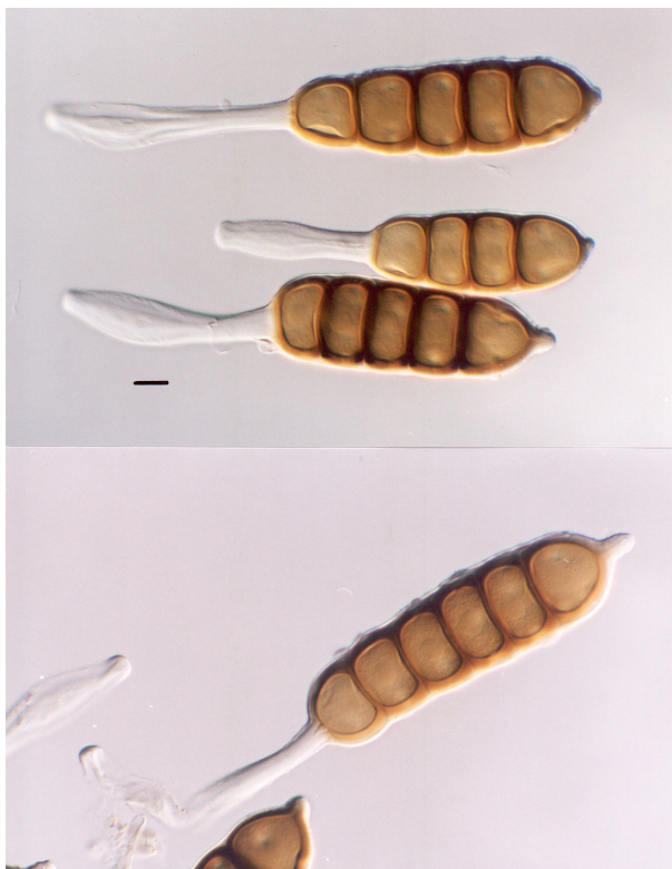
شکل ۳- تلیوسپورهای Phragmidium gorganense M. Abbasi sp. nov. عکس از نمونه تیپ تهیه شده است (خط مقیاس برابر ۱۰ میکرومتر).

هم اندازه یا کوتاهتر از طول تلیوسپور بود. قسمت قاعده تلیوسپور در مجاورت رطوبت متورم شده و ضخامت آن تا ۱۶ میکرومتر می‌رسید (شکل ۳).